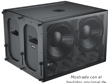
Mostrado con el bastidor opcional de colgado MRF-500