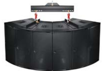
Arreglo horizontal de JM-1P (seis unidades) con dos placas de suspensión MPA-JM1 suspendidas desde un solo punto con la barra separadora MTGSB-4B.

Construido de madera premium terciada de abedul, el durable gabinete del JM-1P está recubierto con un sólido acabado en negro texturizado. Una rejilla de acero con perforación hexagonal con una malla acústica en negro protege los parlantes de la unidad. Otras opciones incluyen protección contra intemperie y colores personalizados para instalaciones fijas y aplicaciones con requerimientos estéticos específicos. La plataforma MDB-JM1 transporta al JM-1P de manera segura; múltiples plataformas se pueden entrelazar para transportar hasta tres JM-1P unidos.